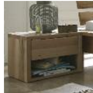
Nachttisch 2: Mit Schublade Night table 2: With drawer Table de chevet nr 2: Avec tiroir