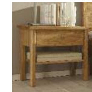
Nachttisch Nr 3: Freistehend Night table no 3: Freestanding Table de chevet n° 3: Non fixé