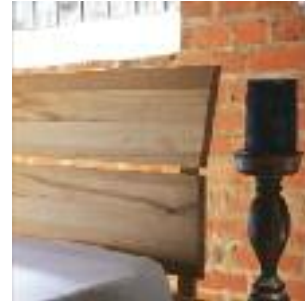
Kopfteil A: 2-geteilt mit Rahmen (Holz) Headboard A: Divided with frame (wood) Tête de lit A: en deux parties avec cadre, bois