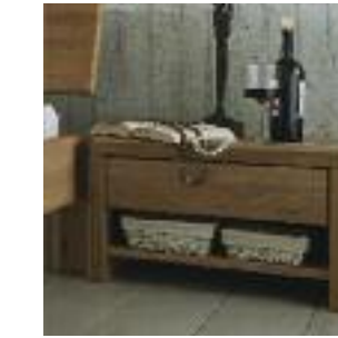
Nachttisch Nr 1: Freistehend Night table no 1: Freestanding Table de chevet n° 1: Non fixé