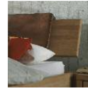
Kopfteil Nr 4B: 1-teilig 30 cm (ohne Leder) Headboard no 4B: 1 board 30 cm (without leather) Tête de lit n° 4B: 1 planche 30 cm (sans cuir)