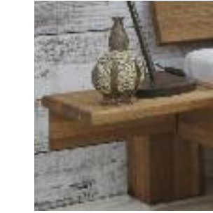
Nachttisch Nr 4: Ablage 9150 Night table no 4: Shelf 9150 Table de chevet n° 4: Etagère 9150