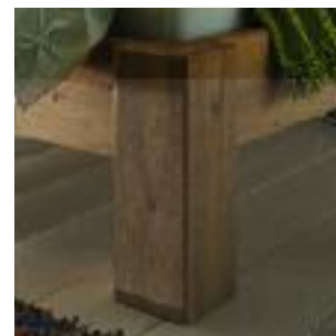
Bettbeine Nr 6: Eckig 14x14 cm Bed legs no 6: Square 14x14 cm Pied de lit n° 6: Carré 14x14 cm