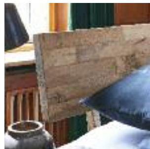
Kopfteil E: 1-teilig Headboard E: 1 board Tête de lit E: 1 planche