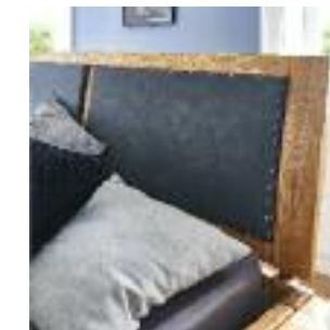
Kopfteil Nr 6: Rahmen mit Kunstleder Headboard no 6: Frame with imitation leather Tête de lit n° 6: Cadre avec cuir PU