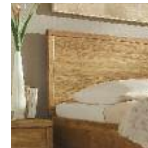
Kopfteil Nr 3: Mit Rahmen Headboard no 3: With frame Tête de lit n° 3: Avec cadre