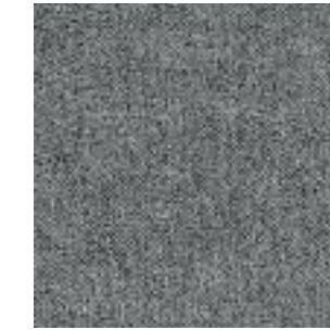
Stoff/Fabric/Tissu: Kiss Grey 65