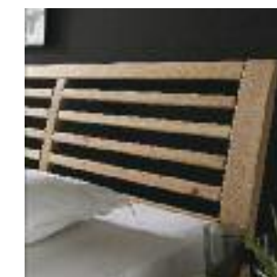
Kopfteil Nr 5: Rahmen mit Sprossen Headboard no 5: Frame with bars Tête de lit n° 5: Cadre avec lamelles