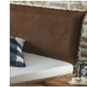
Kopfteil Nr 7: Leder mit Naht Headboard no 7: Leather with stitches Tête de lit n° 7: Cuir avec coutures