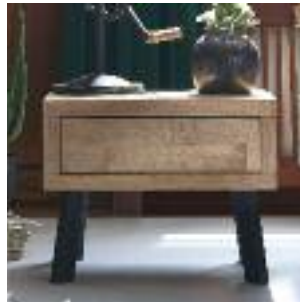
Nachttisch mit Beine B, schräg Night table with legs B, angled Table de chevet avec pieds B, inclinés