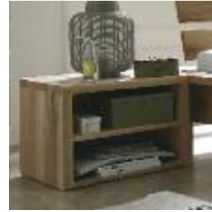
Nachttisch 1: Ohne Schublade Night table 1: Without drawer Table de chevet nr 1: Sans tiroir