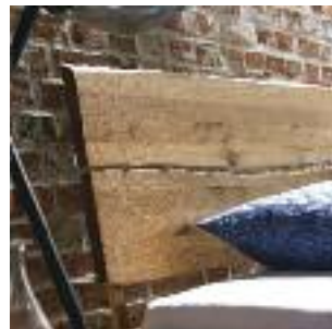
Kopfteil C: 2-geteilt, "Baumkante" Headboard C: Divided, "Baumkante" Tête de lit C: En deux parties, Tronc d'arbre