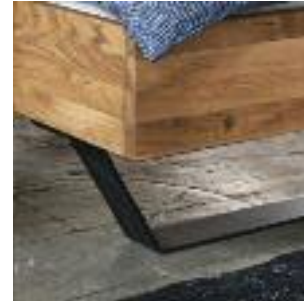
Bettbeine D: Kufen – Eisen Bed legs D: Iron legs Pied de lit D: Luge – métal