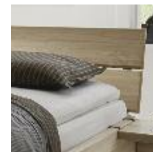
Kopfteil Nr 2: 2-geteilt Headboard no 2: Divided Tête de lit n° 2: En deux parties