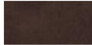
Lederkopfteil/Leather headboard/ Tête de lit cuir: Dark brown