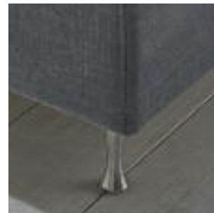
Champagne Fuss, Höhe 14 cm Champagne leg, height 14 cm Pied Champagne, hauteur 14 cm