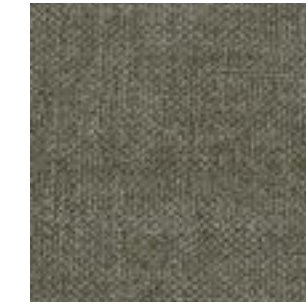
Stoff/Fabric/Tissu: Kiss Army 14