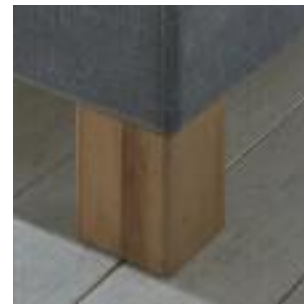
Fuss eckig, Höhe 18 oder 6 cm Leg square, height 18 or 6 cm Pied carré, hauteur 18 cm/6 cm