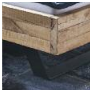
Bettbeine D: Kufen - Eisen Bed legs D: Iron legs Pied de lit : Luge - métal