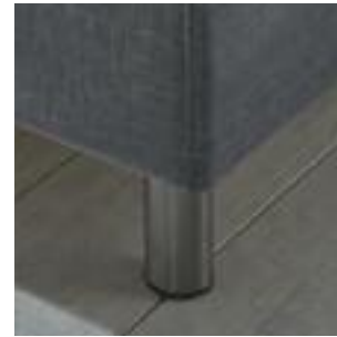
Stahl Fuss, Höhe 14 cm Steel leg, height 14 cm Pied acier, hauteur 14 cm