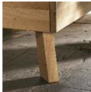
Bettbeine C: Eckig, schräg – Holz Bed legs C: Square, angled - wood Pied de lit C: Pied de lit incliné – bois