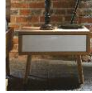
Nachttisch mit Schublade, Front weiss Headboard with drawer, front white Table de chevet avec tiroir, façade blanche