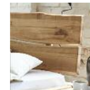
Kopfteil Nr 8: Mit Baumkante Headboard no 8: With wood edge Tête de lit n° 8: Tronc d'arbre