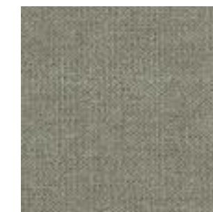
Stoff/Fabric/Tissu: Kiss Natural 01