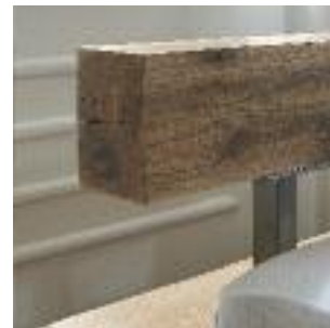
Kopfteil 3: Balken Headboard 3: beam Tête de lit n°3: Poutre