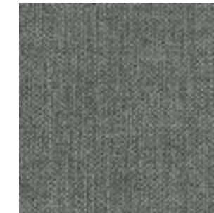
Stoff/Fabric/Tissu: Kiss Stone 181