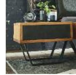
Nachttisch mit Schublade, Front Leder Night table with drawer, front leather Table de chevet avec tiroir, façade cuir