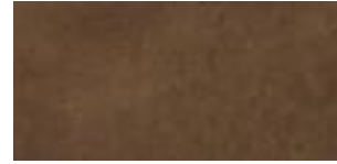
Lederkopfteil/Leather headboard/ Tête de lit cuir: Light brown