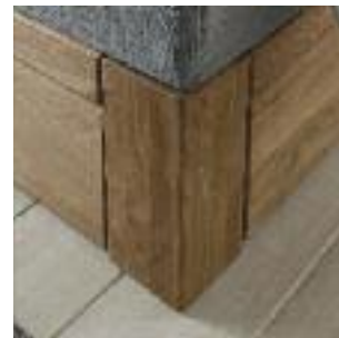
Holzrahmen, Höhe 34 cm Wooden frame, height 34 cm Cadre de bois, hauteur 34 cm