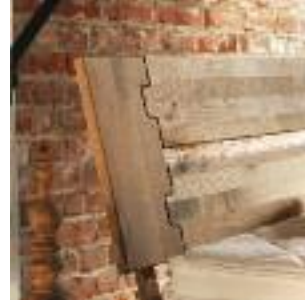
Kopfteil B: 4-geteilt, "Country" Headboard B: Dived in 4, "Country" Tête de lit B: en 4 parties, "Country"