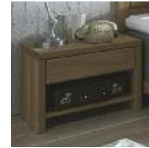
Nachttisch 1A: Freistehend, Höhe 45 cm Night table 1A: Freestanding, height 45 cm Table de chevet 1A: Non fixé, hauteur 45 cm