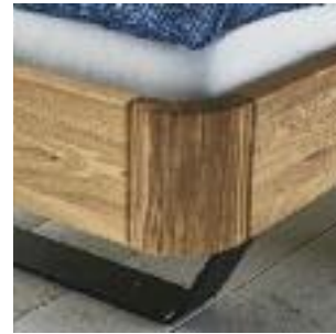
Beine für Rahmen + Kufen Corner for frame + iron legs Pieds pour le cadre + pieds luge