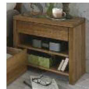
Nachttisch 1B: Freistehend, Höhe 59 cm Night table 1B: Freestanding, height 59 cm Table de chevet 1B: Non fixé, hauteur 59 cm