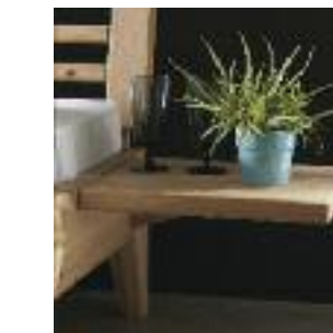
Nachttisch Nr 5: Ablage 5150 Night table no 5: Shelf 5150 Table de chevet n° 5: Etagère 5150