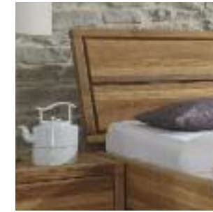
Kopfteil Nr 1: 2-geteilt mit Rahmen Headboard no 1: Divided with frame Tête de lit n° 1: En deux parties avec cadre