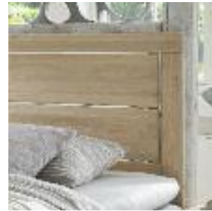
Kopfteil A: 2-geteilt mit Rahmen (Holz) Headboard A: Divided with frame (wood) Tête de lit A: en deux parties avec cadre, bois