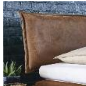
Kopfteil Nr 7: Leder mit Naht Headboard no 7: Leather with stitches Tête de lit n° 7: Cuir avec coutures