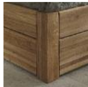
Bettbeine Nr 3: Eckig Bed legs no 3: Square Pied de lit n° 3: Carré