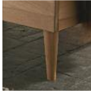
Bettbeine A: Rund/schräg, Holz Bed legs A: Round/conical, wood Pied de lit A: Rond/incliné, bois

Nachttische können nach Wunsch zusammengesetzt werden