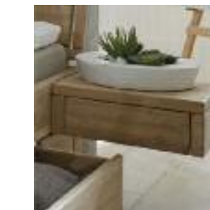
Nachttisch Nr 6: Ablage 5150 + Schublade 5152 Night table no 6: Shelf 5150 + drawer 5152 Table de chevet n° 6: Etagère 5150 + tiroir 5152