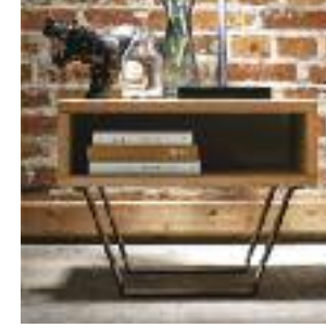
Nachttisch ohne Schublade Night table without drawer Table de chevet sans tiroir