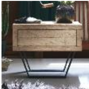
Nachttisch mit Beine D, Kufen Night table with legs D, iron Table de chevet avec pieds D, luge