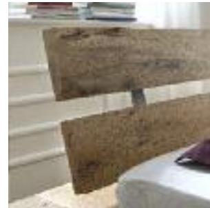
Kopfteil 2: 2-teilig Headboard 2: divided Tête de lit n°2: En deux parties