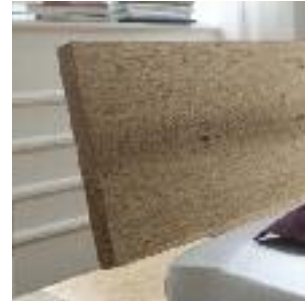
Kopfteil 1: 1-teilig Headboard 1: 1 board Tête de lit n°1: 1 planche