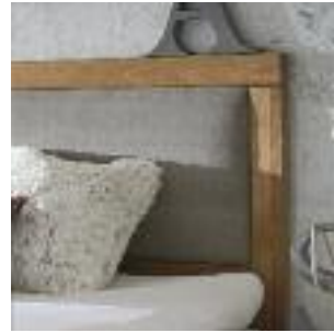
Kopfteil B: Holzrahmen mit Polster Headboard B: Wooden frame with fabric Tête de lit B: cadre de bois avec rembourrage