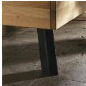
Bettbeine B: Eckig, schräg – Eisen Bed legs B: Square, angled - iron Pied de lit B: Carré, incliné – métal