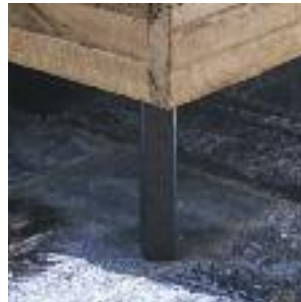
Bettbeine B: Eckig, schräg - Eisen Bed legs B: Square, angled - iron Pied de lit B: Carré, incliné - métal