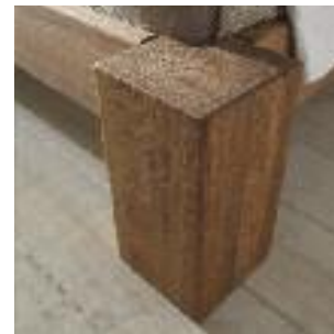
Bettbeine Nr 5: Eckig 18x18 cm Bed legs no 5: Square 18x18 cm Pied de lit n° 5: Carré 18x18 cm