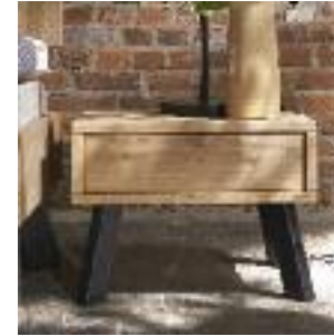
Nachttisch mit Schublade, Front massiv Night table with drawer, front solid Table de chevet avec tiroir, façade massive