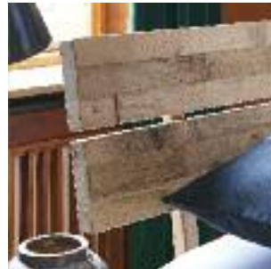
Kopfteil D: 2-geteilt Headboard D: divided Tête de lit D: en deux parties