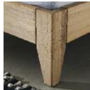
Bettbeine Nr 2: Eckig/abgeschrägt Bed legs no 2: Square/conical Pied de lit n° 2: Carré/conique