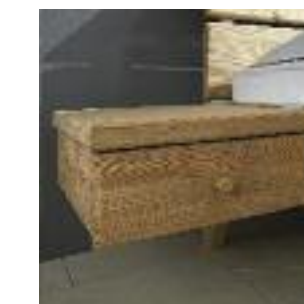
Nachttisch Nr 2: Ablage 9150 + Schublade 9152 Night table no 2: Shelf 9150 + drawer 9152 Table de chevet n° 2: Etagère 9150 + tiroir 9152