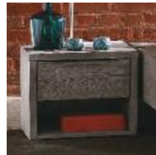
Nachttisch 2: Mit Schublade Night table 2: With drawer Table de chevet nr 2: Avec tiroir