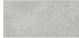
Lederkopfteil/Leather headboard/ Tête de lit cuir: Dirty White