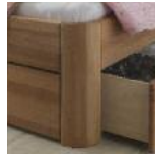
Bettbeine Nr 4: Zylinder Bed legs no 4: Cylinder Pied de lit n° 4: Cylindre