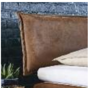
Kopfteil Nr 7: Leder mit Naht Headboard no 7: Leather with stitches Tête de lit n° 7: Cuir avec coutures