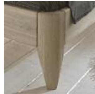
Bettbeine Nr 1: Rund/abgeschrägt Bed legs no 1: Round/conical Pied de lit n° 1: Rond/conique

Zubehör für Kopfteile: Hängekissen & Spot