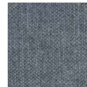
Stoff/Fabric/Tissu: Kiss Blue 45