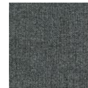
Stoff/Fabric/Tissu: Kiss Graphite 66