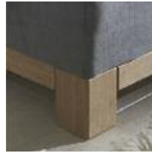
Holzrahmen, Höhe 18 cm Wooden frame, height 18 cm Cadre de bois, hauteur 18 cm